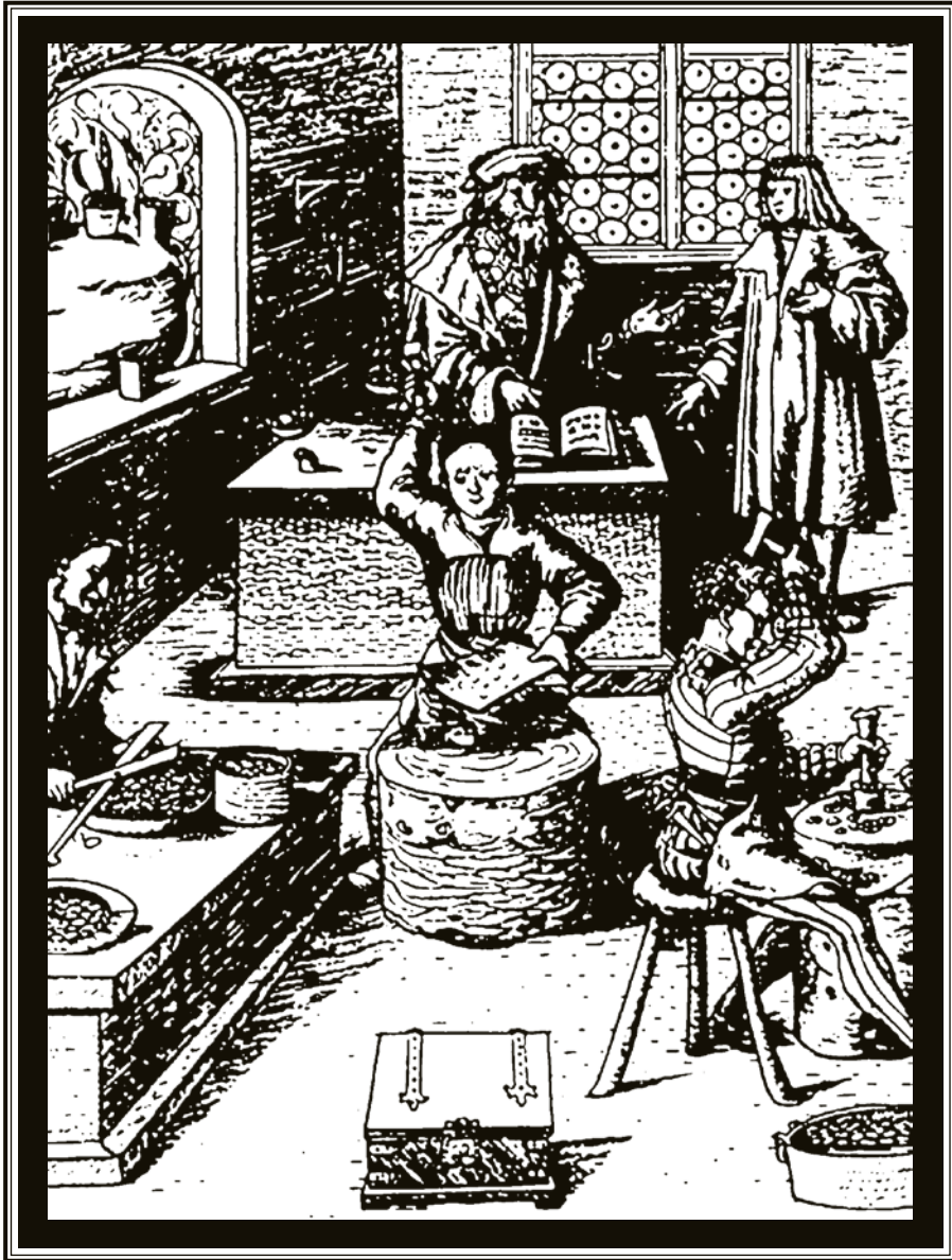
Cunhagem de moeda